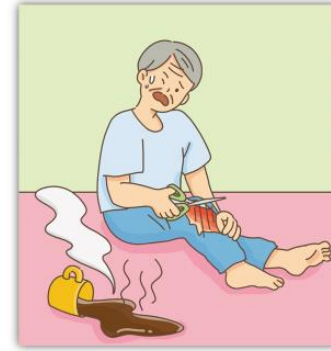
올바른 응급 처치 방법