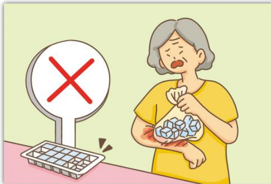
잘못된 응급 처치 방법